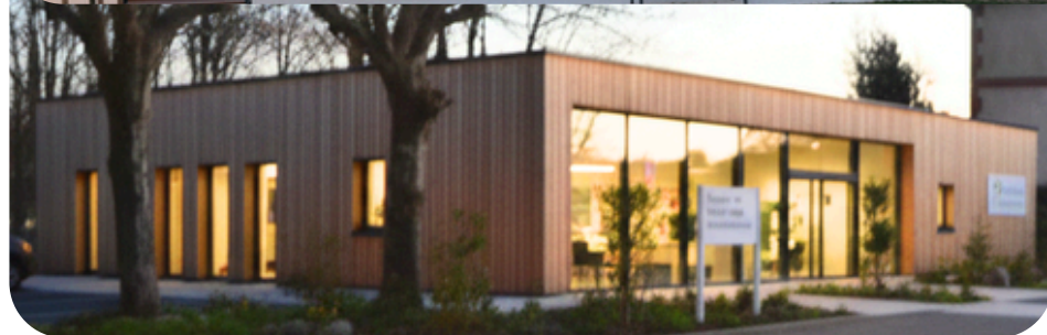
Aménagement du triangle Fauveau (maison de santé, city stade, aire de jeux, table de ping pong)