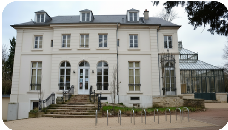
Rénovation énergétique du conservatoire de musique, agrandissement et accès PMR

Nous rénovons le conservatoire pour en faire un lieu accessible et économe en énergie, créerons un bal populaire pour dynamiser la vie culturelle et aménagerons Fauveau avec maison de santé, city stade agrandi et aire de jeux.